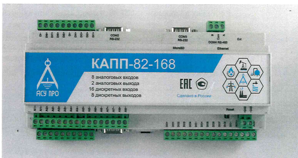
Рисунок 1 - Фотография общего вида контроллера

Фотография общего вида контроллера представлена на рисунке 1.