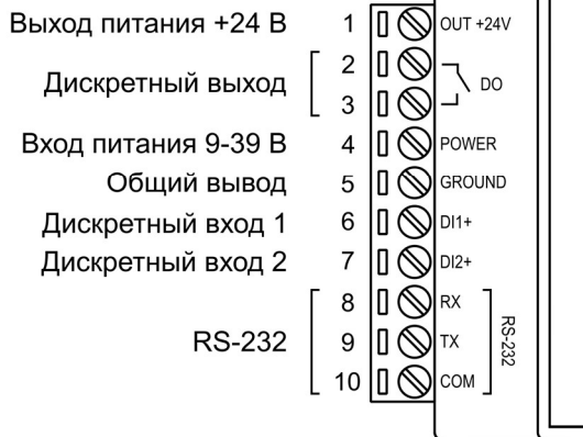
Рисунок 1 – Схема подключения и распиновка контактов УПВН-1